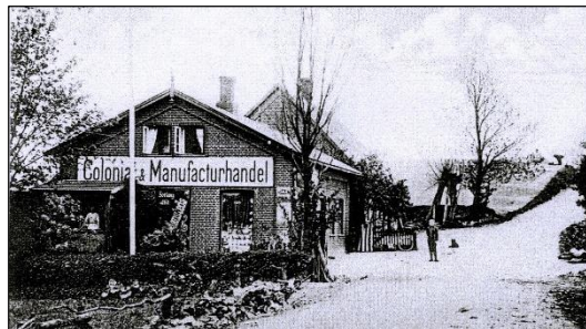
Foto t.h. stammer fra postkort ca. 1909.